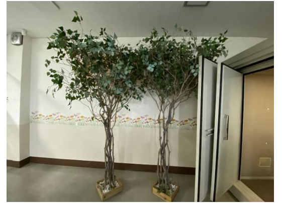
*내부 대형 부스 및 물품 폐기