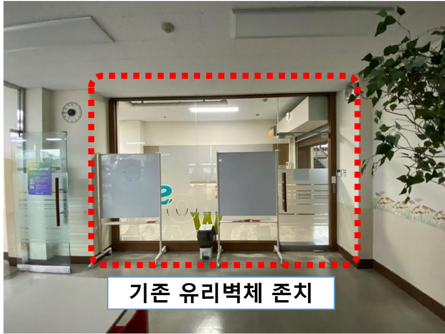
기존 유리벽체 존치