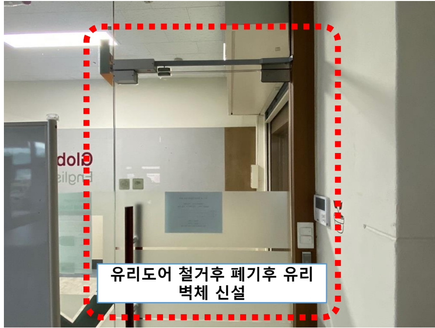
유리도어 철거후 폐기후 유리 벽체 신설