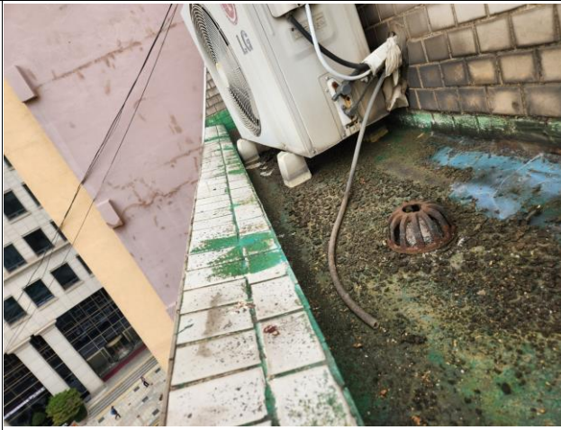
발코니 폴리우레아 방수(드레인 막힘) / 파라펫 드레인 정비(드레인용)