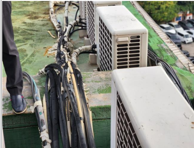
각종 간섭물(실외기, 전선 등) 이격후 작업 및 원상복구