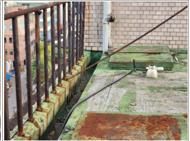
현장여건 감안(단차 및 각종 장비)