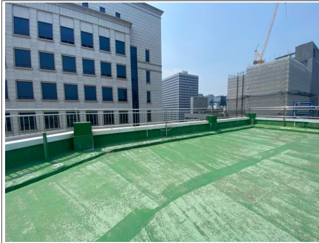
옥상층 바닥 폴리우레아(노출) 시공