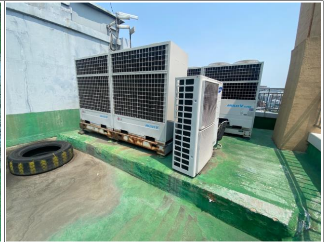
작업시 간섭부위(실외기, 배관, 탱크 등) 바닥이격 및 작업후 원상복귀