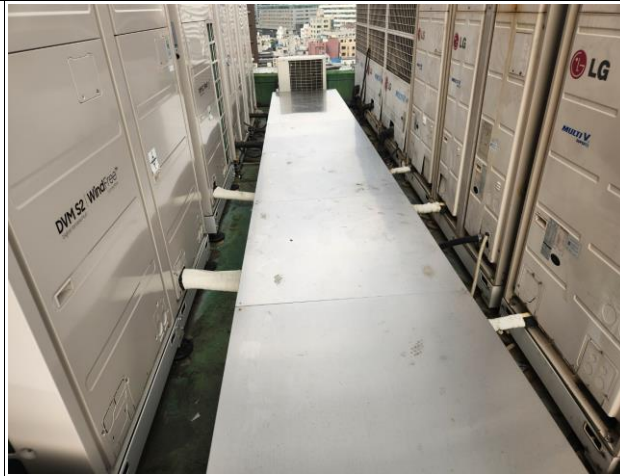
실외기 및 트레이(전선 및 냉매배관용) 필요시 해체후 원상복구