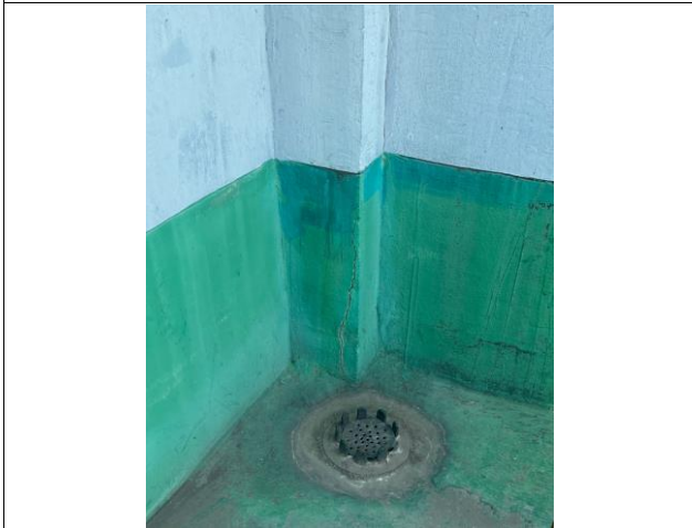
크랙부위 V커팅 + 우레탄실란트 보강 후 폴리우레아 시공