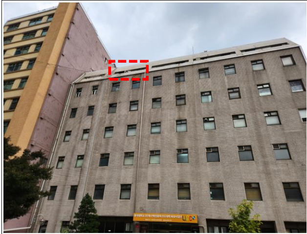
발코니 폴리우레아 방수시 안전여건 고려