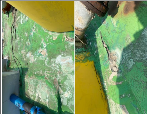
구조체 훼손부위 바탕정리(고강도 몰탈 / 우레탄 실란트 등)