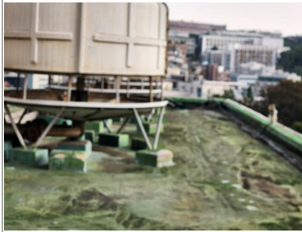
패드 및 파라넷 상단까지 방수면 형성