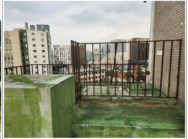
현장여건 감안(단차 및 각종 장비)