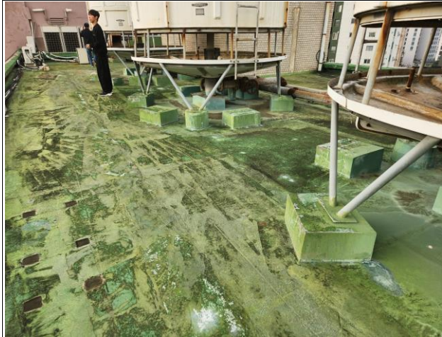
바닥-벽체, 바닥-패드 접하는 부분 우레탄실란트 보강