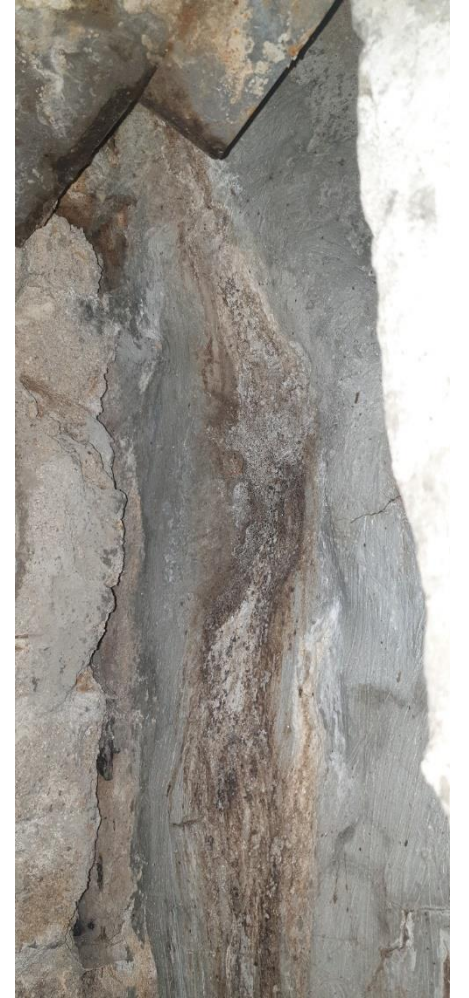
→ 정화조 구조체 탈락 및 균열에 따른 오수 누수