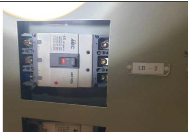
신관 지하 1층 메인 전기실 기존 차단기