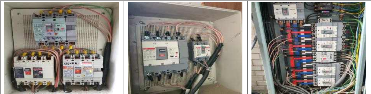
냉난방기용 기존 옥외 분전함(3개소)