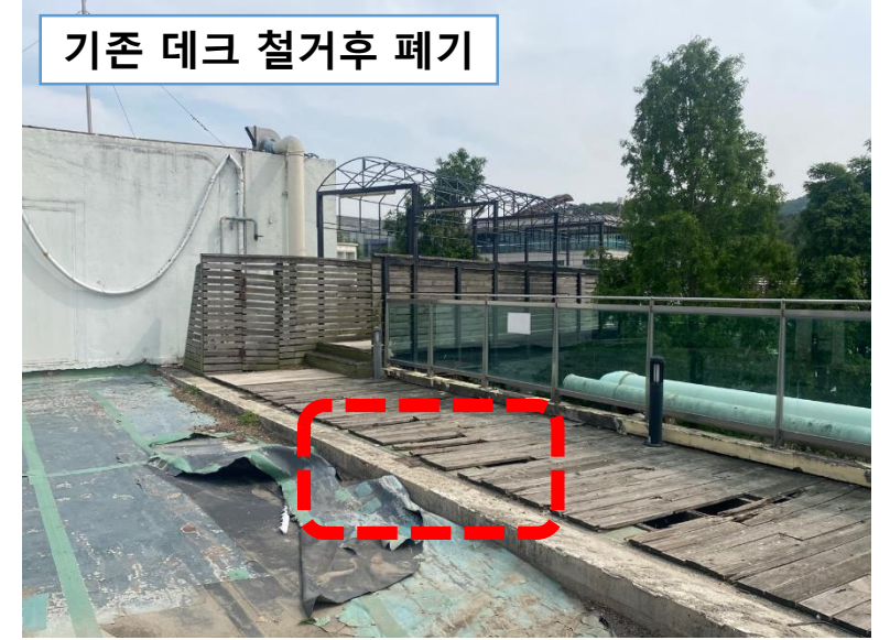
기존 데크 철거후 폐기