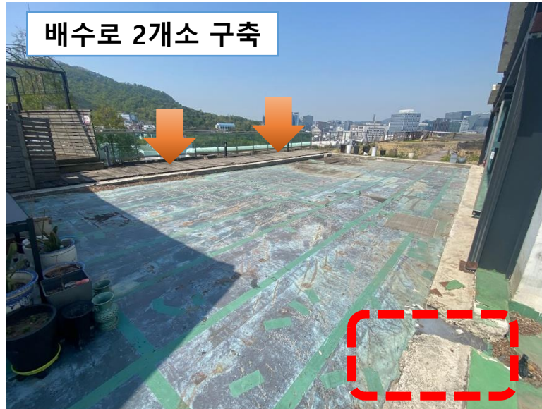
배수로 2개소 구축