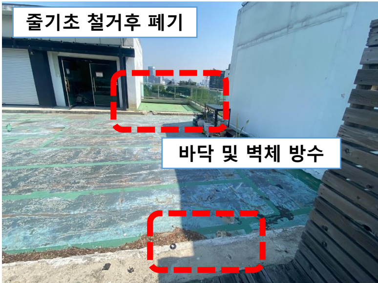
바닥 및 벽체 방수