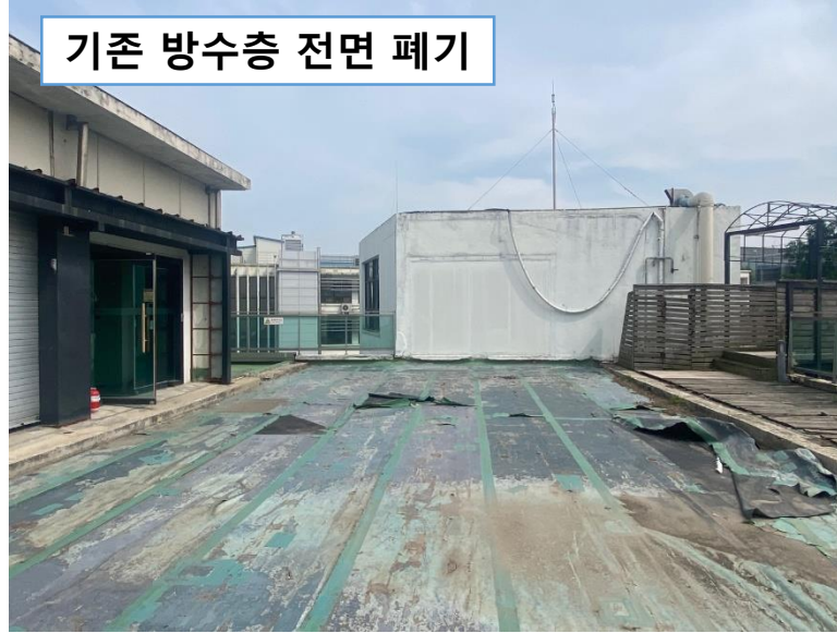
기존 방수층 전면 폐기