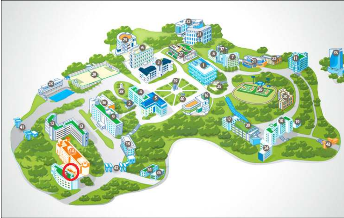
<매장조망 - 실외>

4. 매장입지 및 구조 : 야외 직결 출입구 설치 매장으로, 동대입구 6번출구 200m 이내 위치 <캠퍼스 내 위치 : 학술문화관 지하>