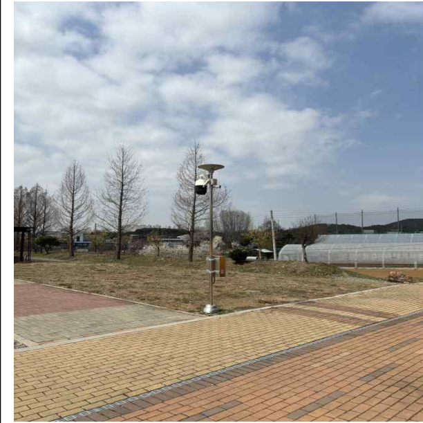
CCTV 및 조명