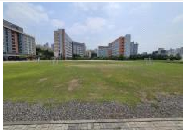
사업대상지 전경 ②