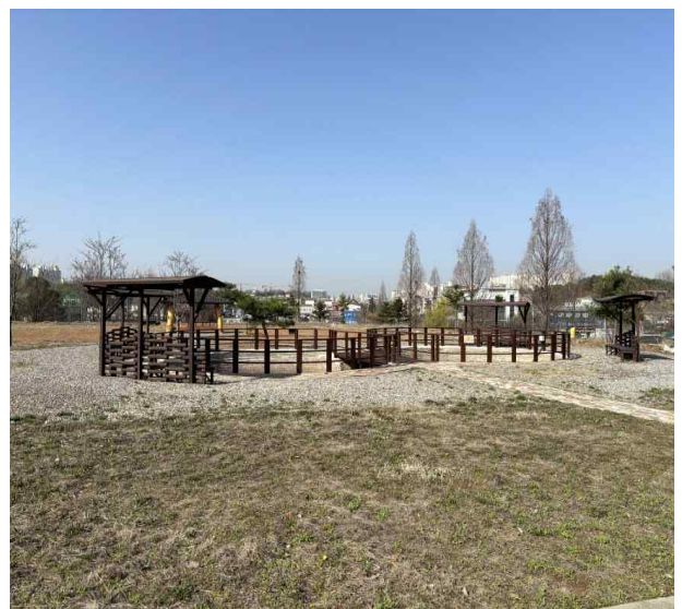
분수대 및 파고라