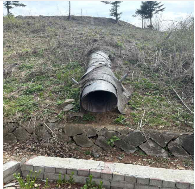
맨홀 측 배수로 (2)