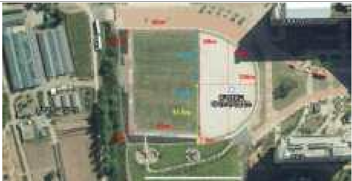
사업대상지 위성 사진