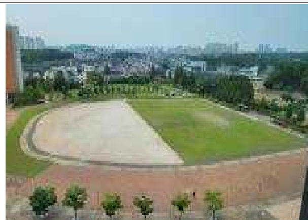
사업대상지 전경 ①