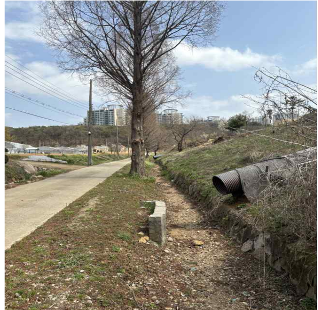
사면 밑 자연배수로