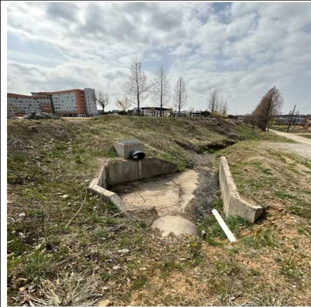
맨홀 측 배수로 (1)