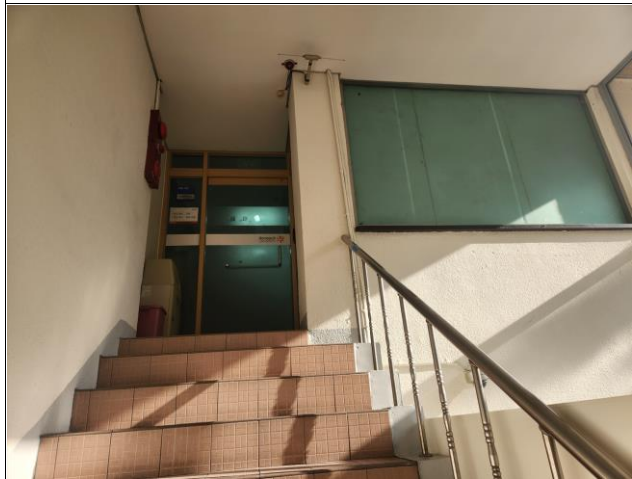
전신문 철거 / 창호 철거후 시공