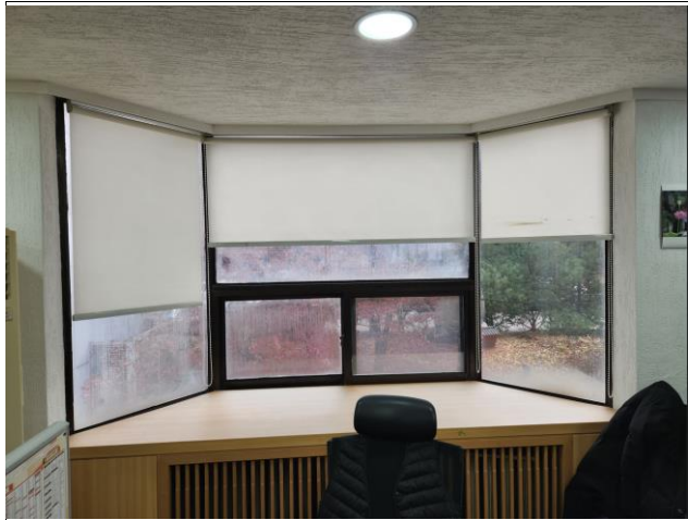
창호 철거 후 재시공 / 하부장(온수방열기 등) 해체