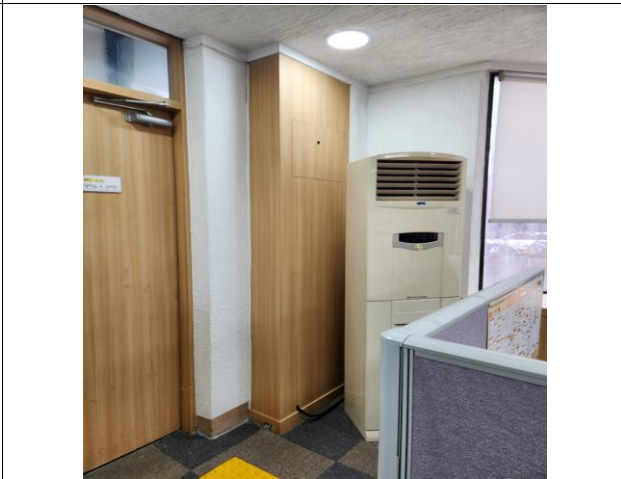
통신 PS 철거(통신공중 협의)