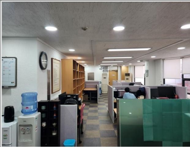
창호 / 바닥 / 천장 / 벽체 철거 후 시공