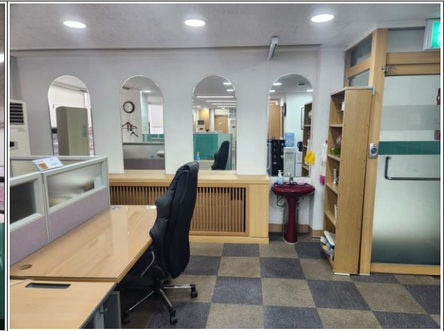
기존 마감재 및 하부장(온수방열기) 철거 후 시공