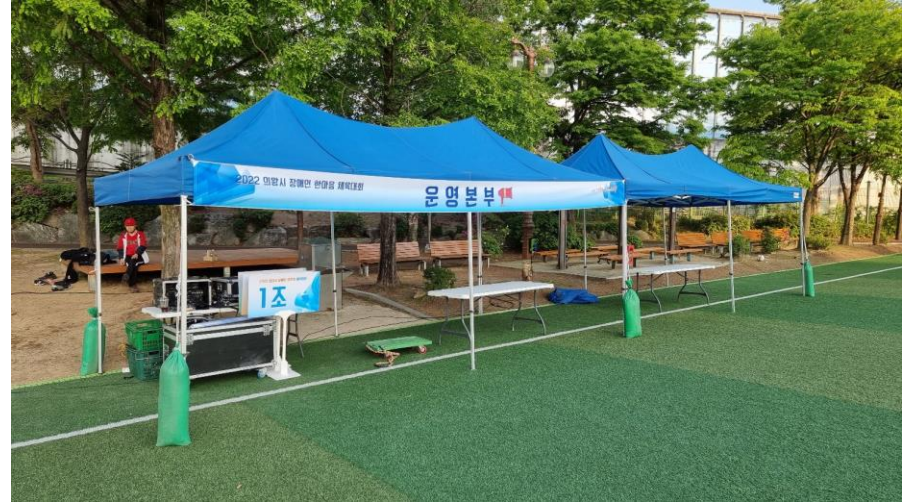
케노피 천막(6m*3m) + 학번 구분 현수막