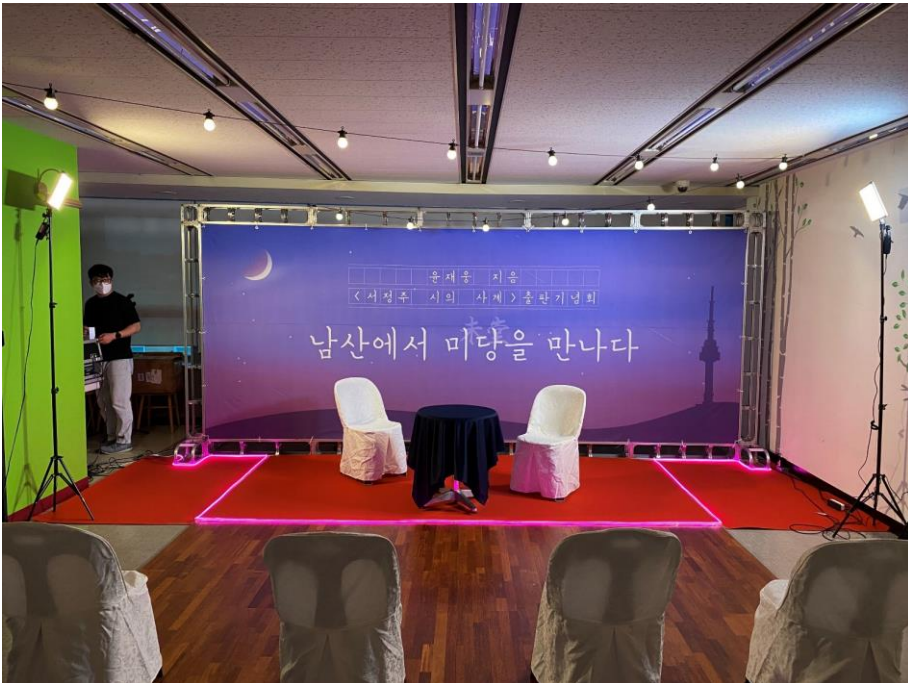
일자형 트러스 백월