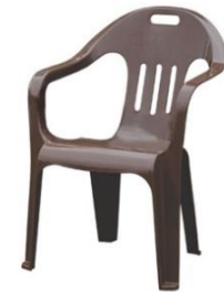
플라스틱 팔걸이 의자 (테이블당 4개)